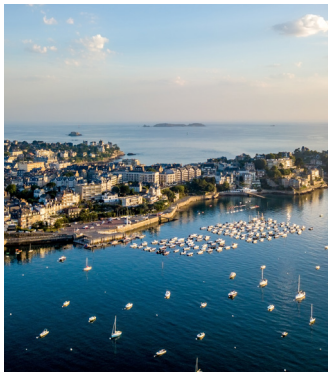
Der Hafen von Dinard