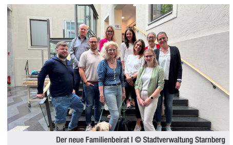
Der neue Familienbeirat