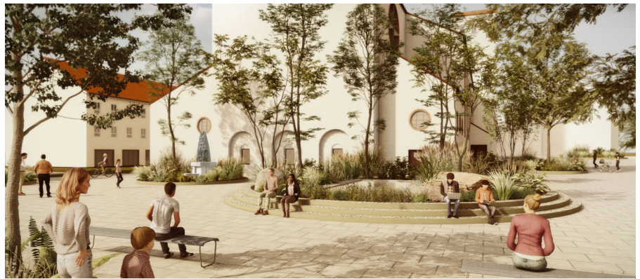
Runde Pflanzbeete für mehr Grün

Der ausgearbeitete Entwurf umfasst nun an der Nordostecke der Kirche ein zentrales, großes, rundes Pflanzhochbeet, das den großen rechteckigen Brunnen in gleicher Höhe umfasst und mit radialen Sitzstufen ergänzt.