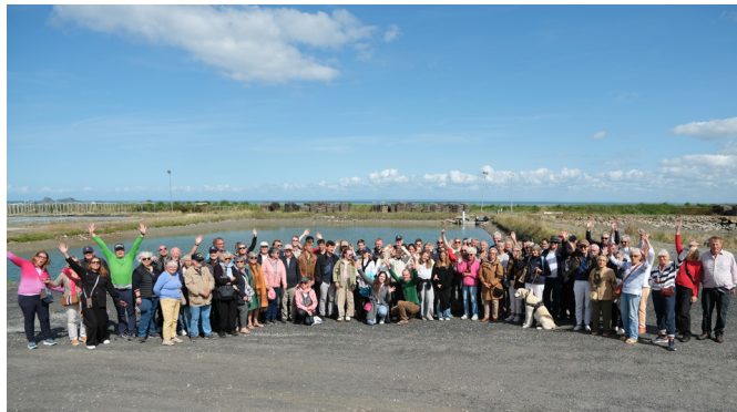
Besuch in Dinard im September 2025