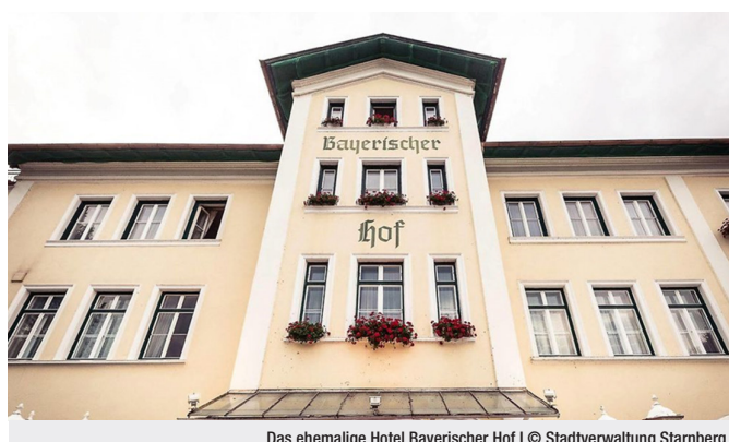
Das ehemalige Hotel Bayerischer Hof

Im Mai 2025 war der Konzeptwettbewerb mit dem einzigen Interessenten vom Stadtrat einstimmig aufgehoben worden. Vor fünf Jahren musste die Stadt Starnberg den denkmalgeschützten Bayerischen Hof wegen Brandschutzmängeln und Einsturzgefahr schließen und sucht seitdem nach einer Lösung für das sanierungsbedürftige Gebäude.