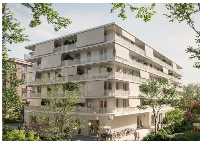
Moo 2 | © Visualisierung: Zoom VP | Architekten: Kaufmann Riepl's Bammer Architektur