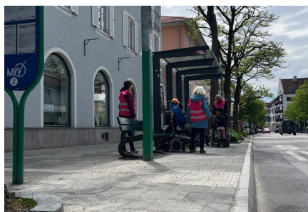
Bordsteine als Einschränkung im Alltag

Jährlich findet am 5. Mai der Europäische Protesttag zur Gleichstellung von Menschen mit Behinderung statt. Die mit rosa Warnwesten gekleidete Gruppe bewertete schwierige Punkte mit Karten in den Ampelfarben. Dadurch sollte auf neuralgische Stellen hingewiesen und mit Nachdruck auf eine Verbesserung hingewirkt werden. In vielen Fällen verbessern kleine Veränderungen die Zugangsmöglichkeiten enorm. In die Umplanungen des Kirchplatzes sind die angesprochenen Aspekte bereits eingeflossen und waren hilfreiche Hinweise für das Planungsteam.