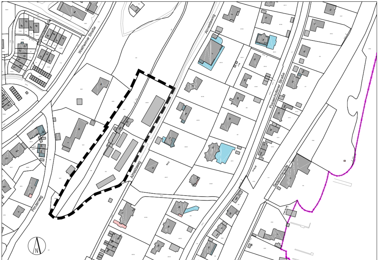
Umgriff der 60. Flächennutzungsplanänderung