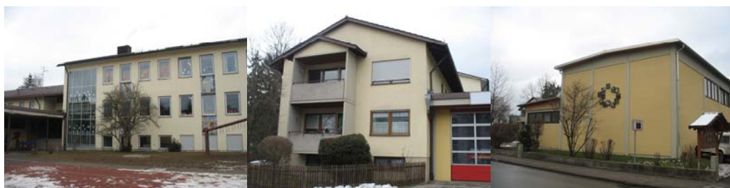
Abb. 1-1.: Gebäude der Liegenschaft Grundschule Percha

Es ist ein Gesamtsanierungskonzept der Gebäudehülle (Kostengruppe 300) und der technischen Anlagen (Kostengruppe 400) erstellt worden. Die Ausarbeitung der Sanierungskonzepte wurden in enger Abstimmung mit dem Auftraggeber durchgeführt.