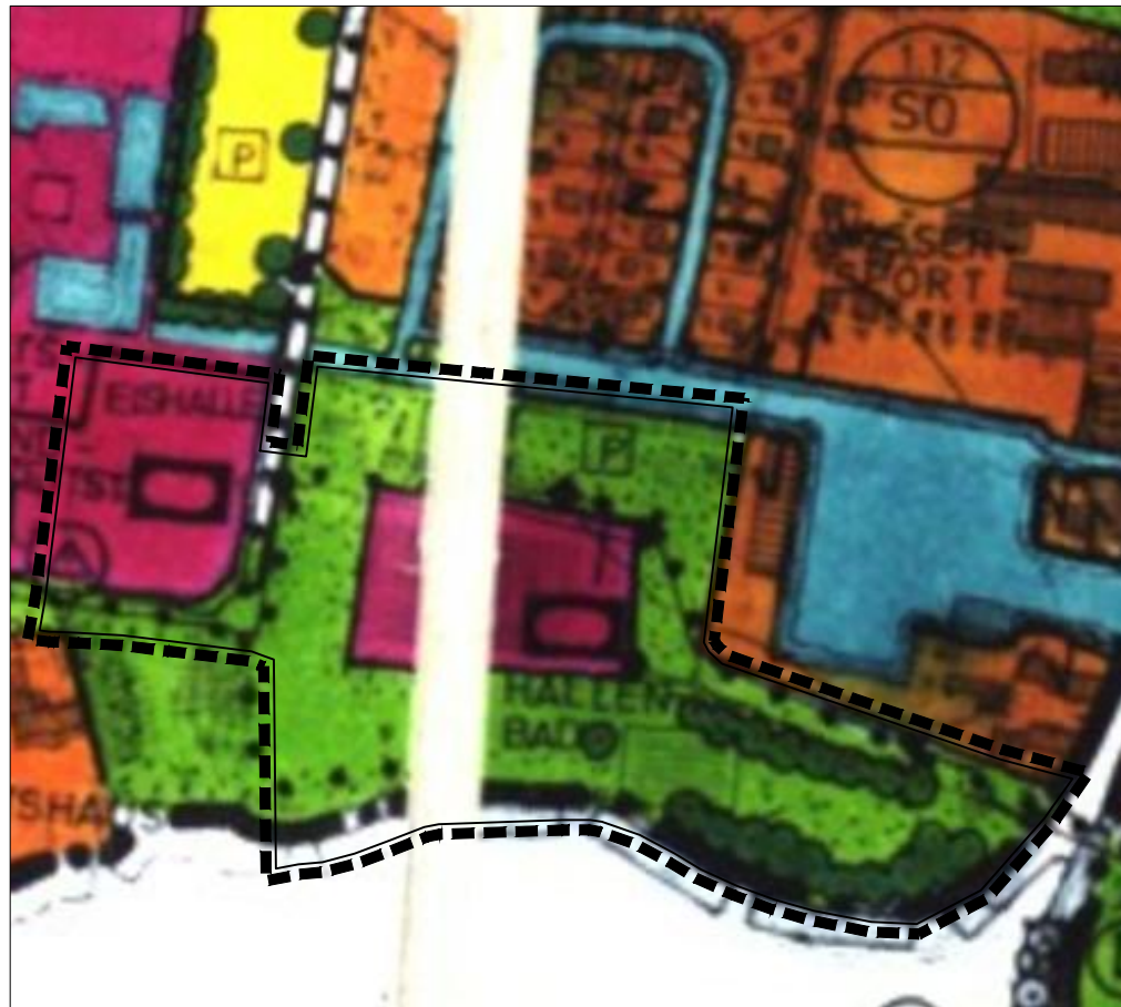
Ausschnitt aus dem rechtswirksamen Flächennutzungsplan M 1: 2.500